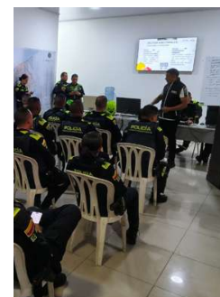
CNE capacitó a 235 uniformados en La Guajira.

dirigidas a miembros de la Fuerza Pública y actores electorales.